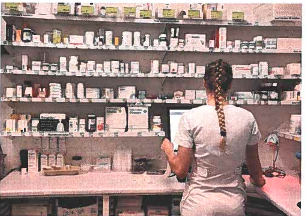
Medicin er et fast element i hverdagen for mange af beboerne på Aarhus Kommunes bosteder for handicappede. Men pårørendeforeningen LEV Aarhus peger på, at håndteringen af medicinen nogle steder kan skabe udfordringer til ulempe for beboerne.

ne Kjeld Pedersen om sager, som LEV Aarhus på baggrund af blandt andet forældrehenvendelser har registreret omkring omsorgssvigt på en bred vifte af kommunens botilbud for handicappede.